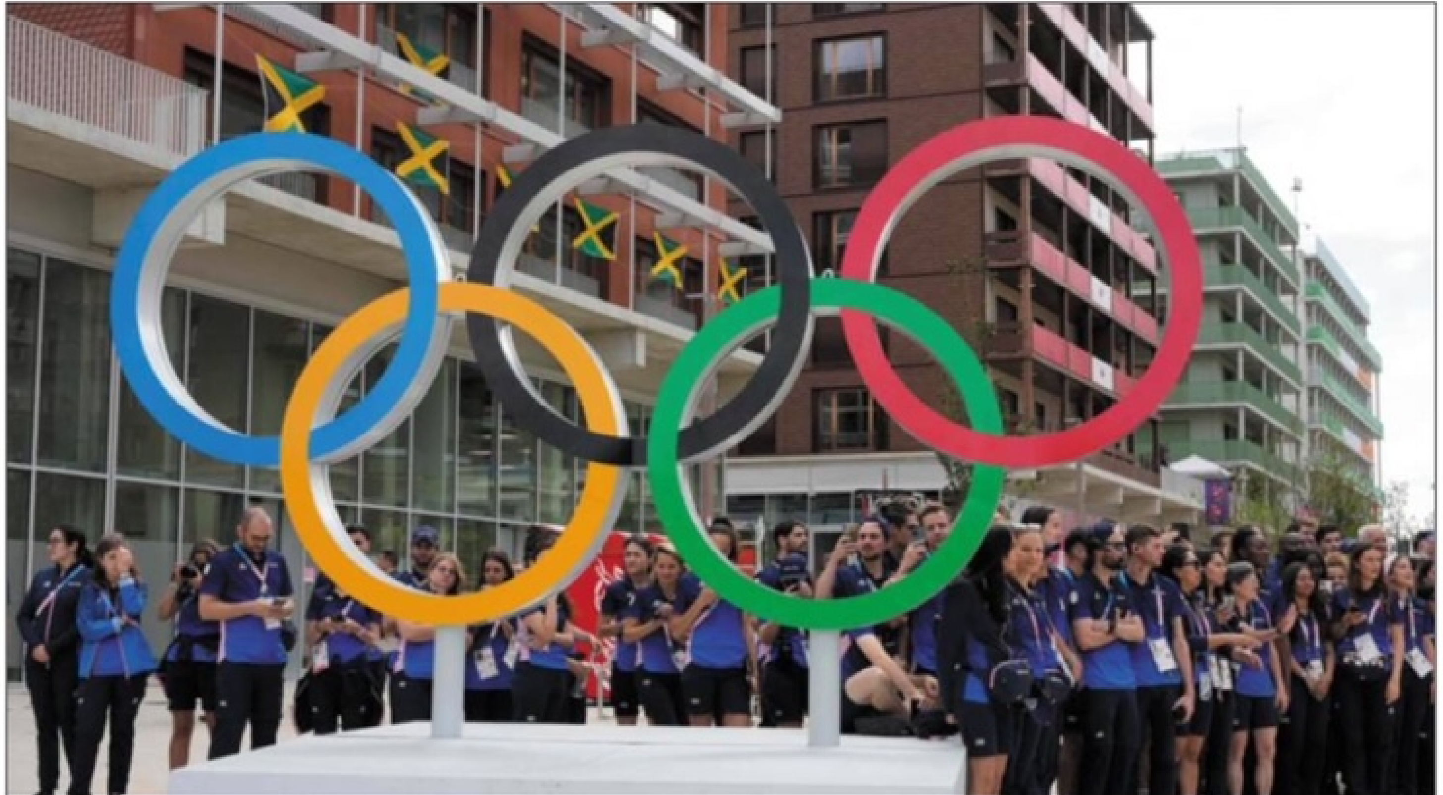
Les athlètes monégasques ont été bluffés par le Village et l'ambiance qui y règne déjà.

AVEC LE CONCOURS DE STÉPHAN MAGGI, COMITÉ OLYMPIQUE MONÉGASQUE